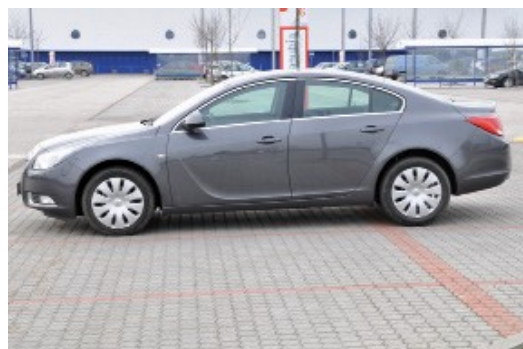
Kolmý záber na celý ľavý bok