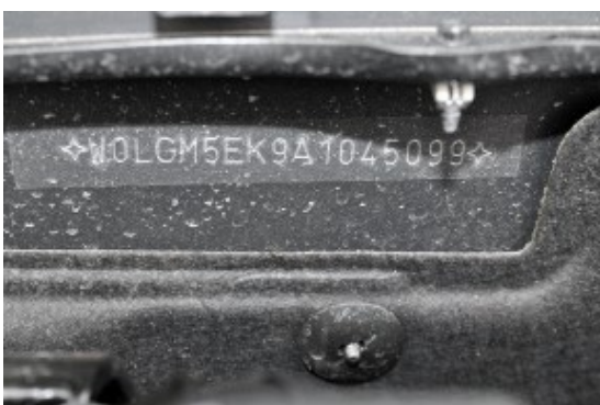
Záber na VIN číslo (z motorovej časti)