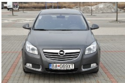
Kolmý záber na celé vozidlo spredu