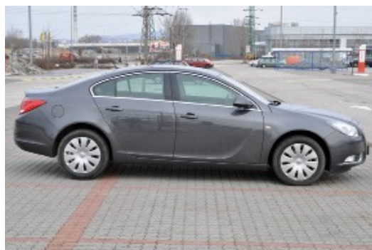
Kolmý záber na celý pravý bok