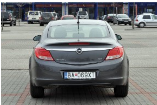
Kolmý záber na celé vozidlo zozadu