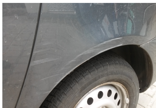
Detail na poškodenie vozidla