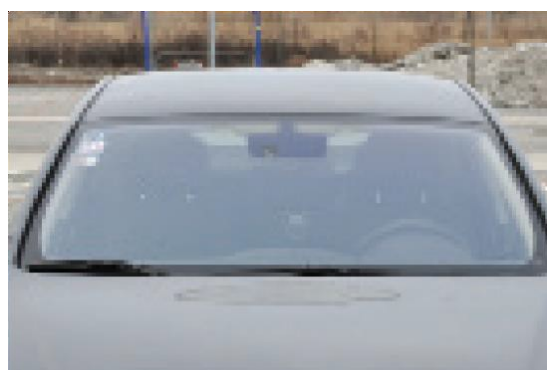
Detailný záber na čelné sklo – pre pripoistenie skiel